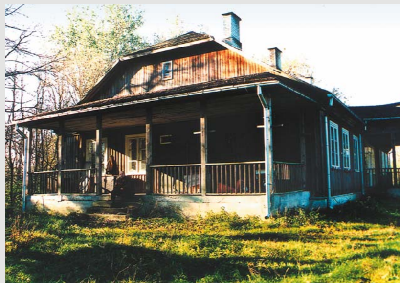
Dwór w Krasnogródzie. Tutaj przed wojną Miłosz przyjeżdżał na wakacje, 1994