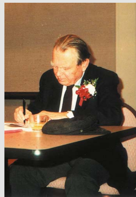
Miłosz podpisuje książki po spotkaniu na Marquette University, Wisconsin, 20 października 1991