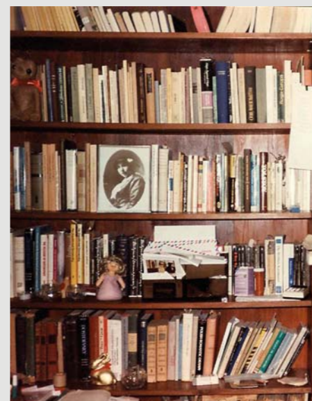
Półka z książkami w gabinecie poety w jego domu, Berkeley, 7 sierpnia 1988