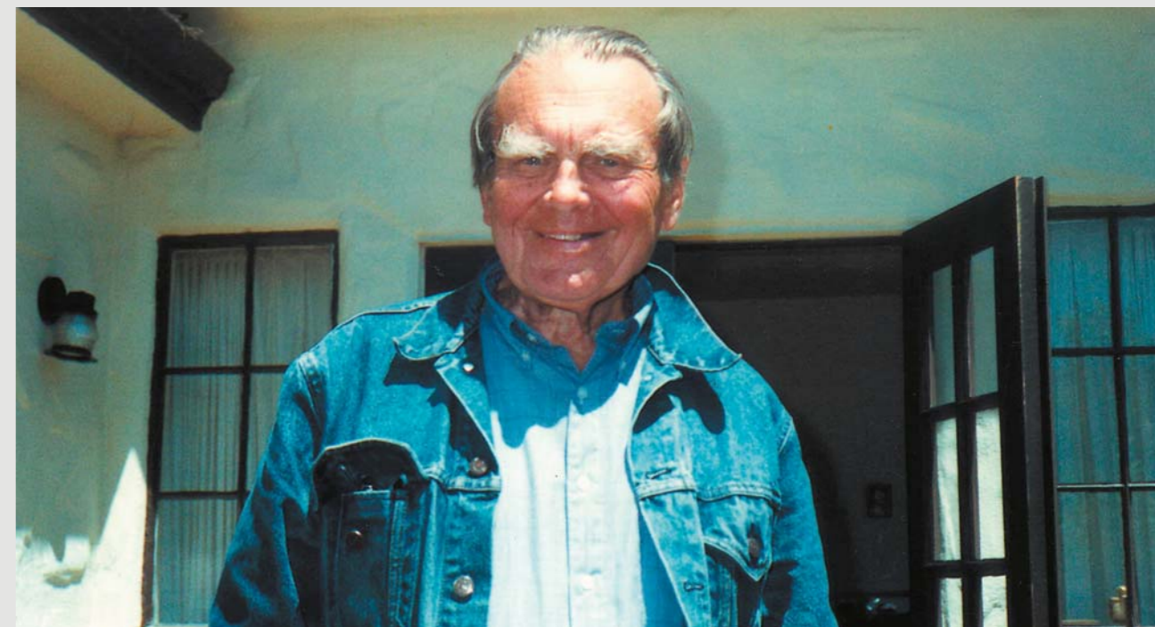
Poeta w ogrodzie z tyłu domu, 7 sierpnia 1988