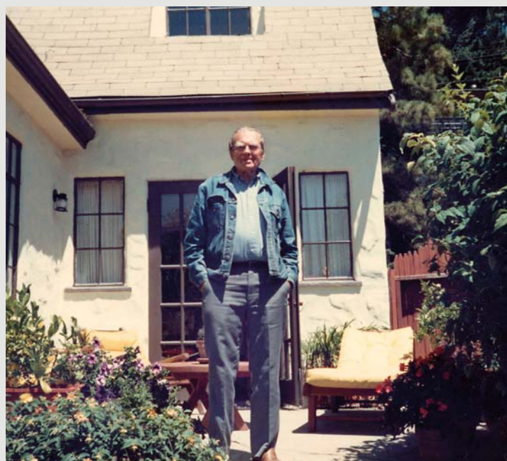
Poeta w swoim ogrodzie z tyłu domu, 7 sierpnia 1988