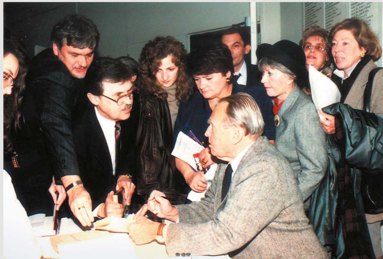
Miłosz podpisuje książki po spotkaniu w Chicago Arts Institute, jesień 1991

Senat RP ustanowił rok 2024 Rokiem Czesława Miłosza.