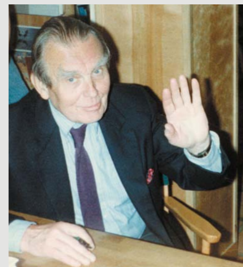
Poeta pozdrawia znajomych w Black Oak Bookstore, Berkeley, jesień 1987