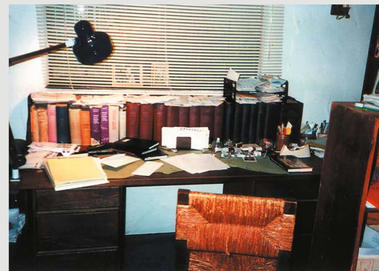
Biurko poety w jego gabinecie jego domu, Berkeley, 7 sierpnia 1988