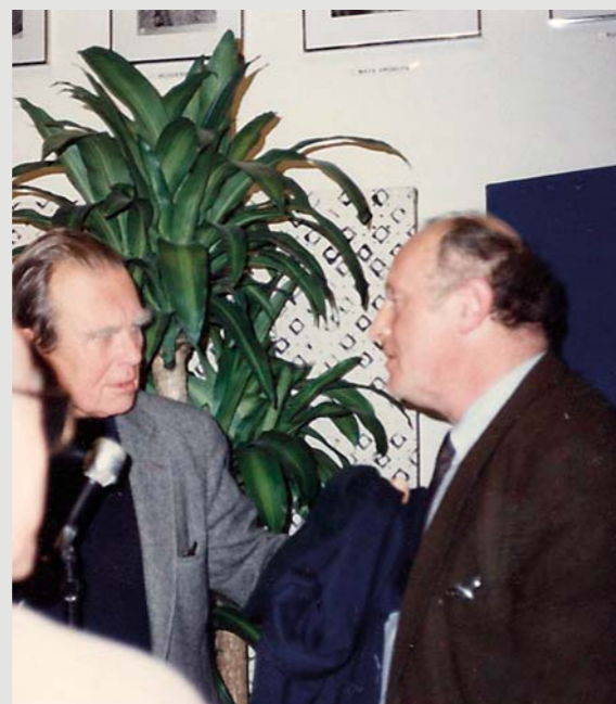
Spotkanie poetyckie: Czesław Miłosz i Joseph Brodsky, Berkeley, 14 listopada 1988